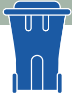
Caja o bote azul / Blue cart

418 883-3347 info@mr@mrcbellechasse.qc.ca www.mrcbellechasse.qc.ca/gmr