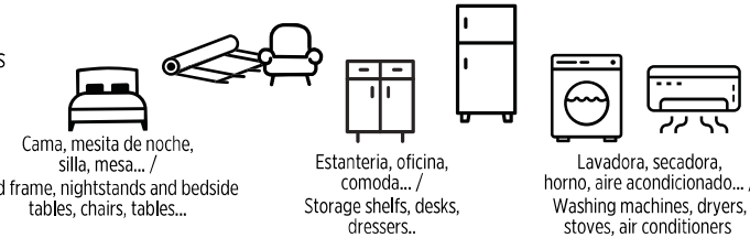
Cama, mesita de noche, silla, mesa... / Bed frame, nightstands and bedside tables, chairs, tables...

Muebles y electrodomésticos en buen estado / Furniture and appliances