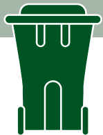
Caja o bote verde / Green cart

* ¿Te gustaría obtener ayuda con el compost? Obtener información del MRC. / Need help to compost at home? Please, contact us.