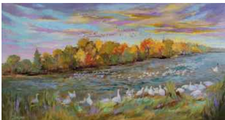
PAULINE L'HEUREUX DE RETOUR SAINT-ANSELME