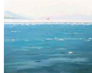
CLAUDE DE LORIMIER SAINT-VALLIER SAINT-VALLIER