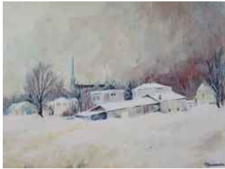
PAULE DOMBROWSKI L'HIVER À SAINT-MICHEL SAINT-MICHEL-DE-BELLECHASSE