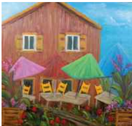
HÉLÈNE GINGRAS BIENVENUE À SAINT-VALLIER SAINT-VALLIER