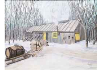
JOSETTE LACROIX CABANE À SUCRE D'ANTAN SAINT-GERVAIS