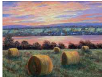
ÉDITH CARON UNE JOURNÉE PARFAITE BEAUMONT