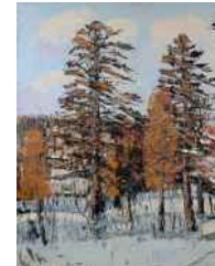
CÔME LAFLAMME POINTE DU LAC CRÈVE-FAIM EN JANVIER NOTRE-DAME-AUXILIATRICE-DE-BUCKLAND