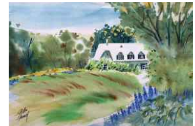
GILLES HAMEL L'ÉTÉ, POINTE-DE-SAINT-VALLIER SAINT-VALLIER