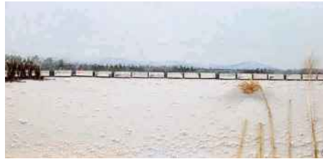
STÉPHANIE LAMONTAGNE LE TRAIN SAINT-HENRI